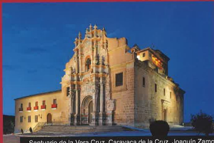
Santuario de la Vera Cruz. Caravaca de la Cruz. Joaquín Zamora