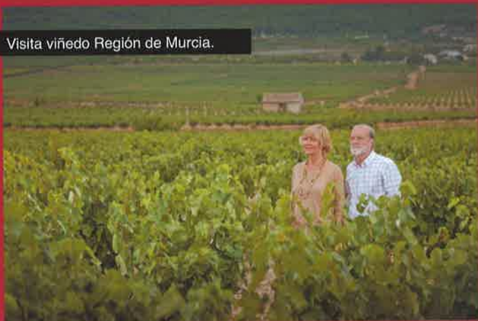
Visita viñedo Región de Murcia.