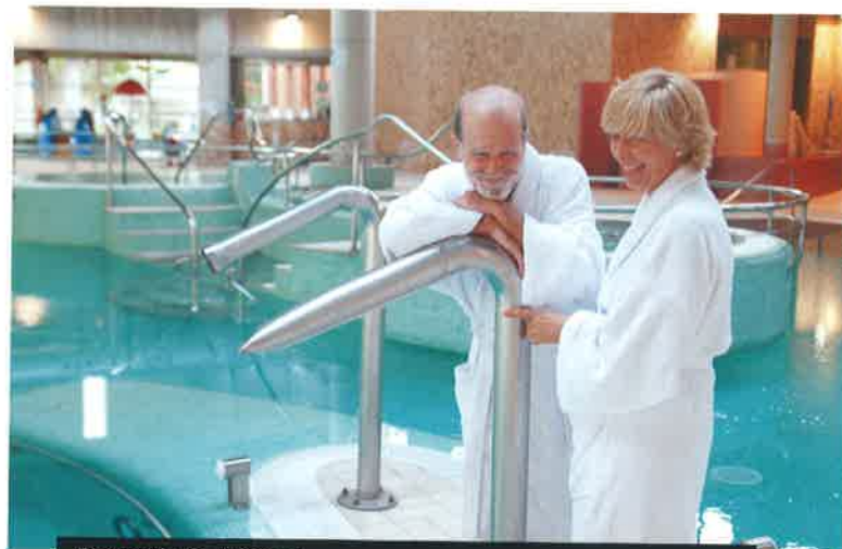
Balneario de Archena.

Año Jubilar, lo que convirtió a esta ciudad en la quinta del mundo que, junto a las otras cuatro (Santiago de Compostela, Santo Toribio de Liébana, Roma y Jerusalén), puede celebrar el Jubileo Perpetuo. Esto significa que la Santa Sede concedió el poder celebrar Año Santo cada siete años in perpetuum en el Santuario de la Vera Cruz, siendo el próximo Año Jubilar en 2017. Sin embargo, el Santuario, que posee un interesante Museo de Arte Sacro e Historia, no es el único monumento religioso de Caravaca. Del s. XVI datan las interesantes iglesias de la Soledad, hoy convertida en Museo Arqueológico; El Salvador, considerada como la obra cumbre del Renacimiento murciano, y la iglesia de la Purísima Concepción, a las que hay que sumar el Convento de los Carmelitas. En cuanto al poder