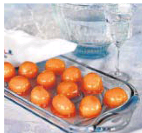
Gastronomía Migas, arroces y, de postres, yemas (foto) o alfajor

mente para explorar en la historia, el Museo Etnográfico en Miniatura Ángel Reinón rescata antiguos oficios como el de herrero, con 400 piezas en exposición, mientras que el Museo de Música Étnica recopila instrumentos y sonidos de 145 países, de la colección de Carlos Blanco Fadol. Cuenta con una sección en homenaje a Barranda y su «Fiesta de las Cuadrillas», un acontecimiento de renombre.