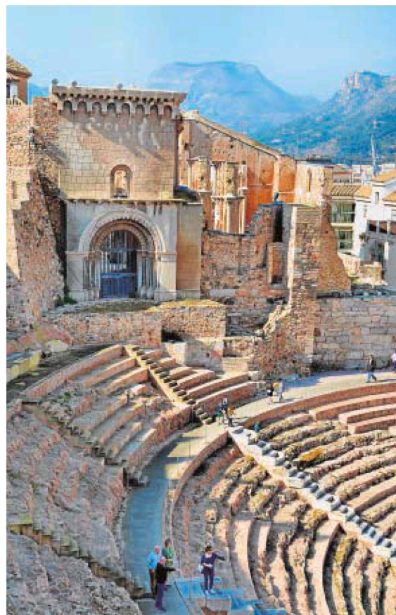
Teatro Romano de Cartagena e iglesia de Sta. María La Vieja. Debajo, Asdrúbal El Bello

los restos de un palacio islámico y algunas viviendas del siglo XII, conserva algunos de los ejemplos más puros de arquitectura islámica y un infrecuente fragmento de adaraja mozárabe con la figura de una mujer tocando el mizmar.