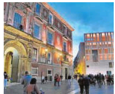
Murcia. Palacio Episcopal y Ayuntamiento de Moneo